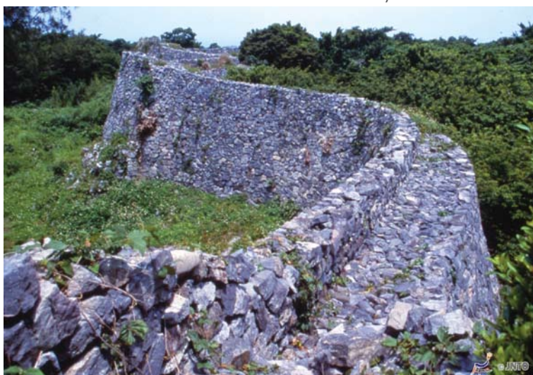
Ruínas do Castelo Nakijin