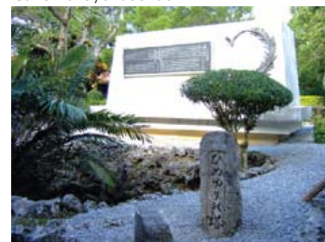
Monumento de Himeyuri