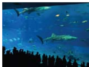
Expo Ocean Park

Após café da manhã, passeio pela região norte da Ilha de Okinawa. Passagem pelo Cabo de Manzamo com vista panorâmica, visita ao enorme parque de diversões Expo Ocean, às ruínas do Castelo Nakijin e à Plantação de Abacaxi Nago Nakayama. Almoço incluso em restaurante local. Término do passeio no terminal rodoviário.