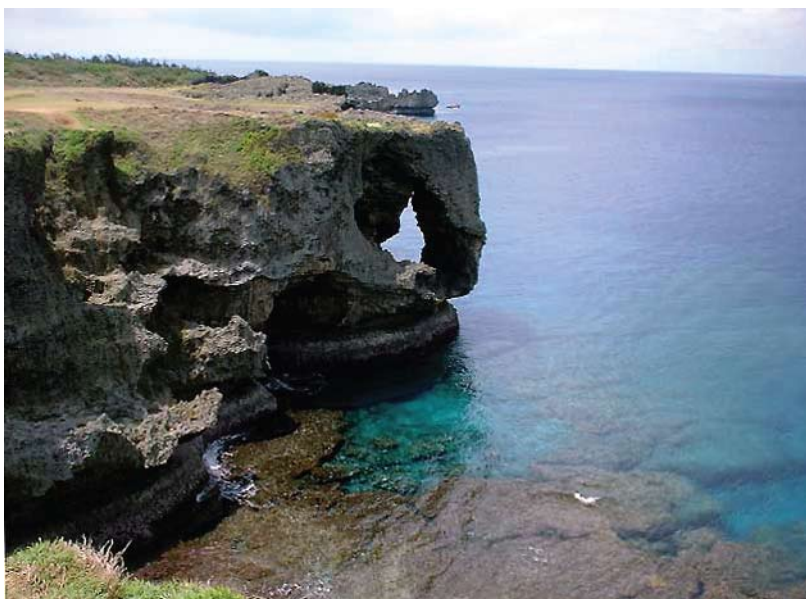
Cabo de Manzamo

Traslado ao aeroporto de Naha. Fim dos serviços.