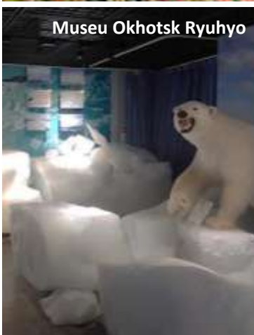
Museu Okhotsk Ryuhyo