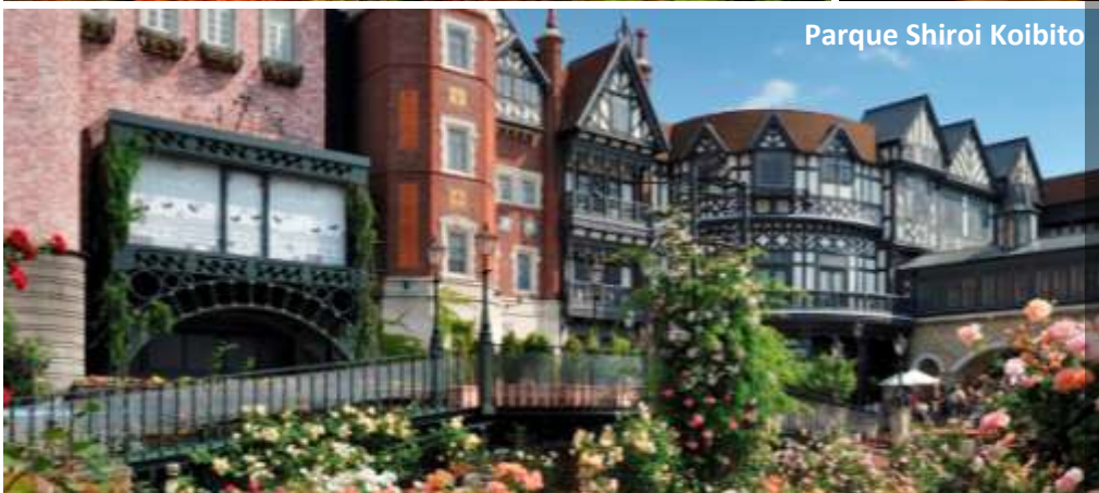
Parque Shirai Koibito