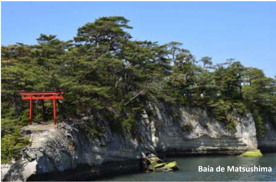
Baía de Matsushima